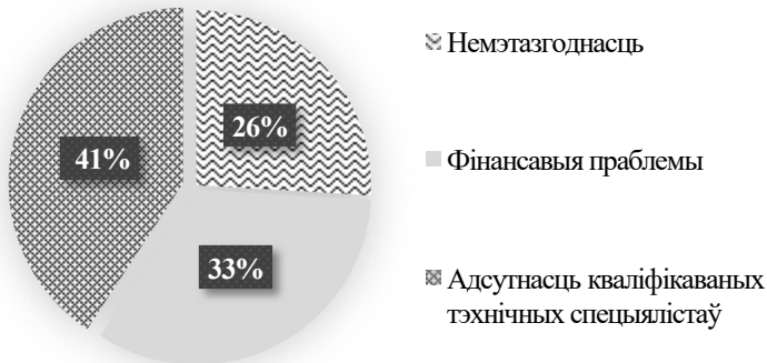
Малюнак 1. Прычыны, якія перашкаджаюць архіўным установам распрацаваць уласны вэб-сайт

13 абласных і занальных беларускіх архіваў. Іншым вырашэннем праблемы, якое не патрабуе сур'ёзных матэрыяльных выдаткаў, магло б стаць актыўнае выкарыстанне сацыяльных сетак, аднак уласныя старонкі на такога кшталту анлайн-платформах маюць толькі 6 нацыянальных архіўных устаноў (яны прысутнічаюць у Facebook і YouTube). Аднак у дадзеным выпадку можна гаварыць ужо не столькі пра аб'ектыўны, колькі пра суб'ектыўны фактар — агульны інэртнасць і фармалізм айчыннага архіўнага асяроддзя.